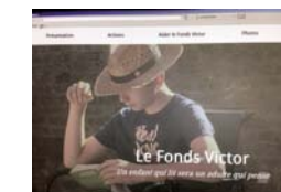
Page facebook Paris Match likes Belgium, 29 septembre.